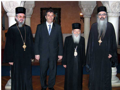
VOJISLAV KOŠTUNICA (DRUGI S LEVA)

Osim toga, Koštunica se oštro suprotstavlja NATO članstvu. On traži referendum o (ne)pristupanju Alijansi i to što pre. Takodje otvoreno podržava podelu BiH i Kosova.