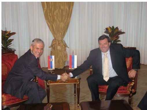
BORIS TADIĆ I MILORAD DODIK

je da neke od nadležnosti koje se pominju obuhvataju nadležnosti koje su izričito nabrojane u Ustavu kao nadležnosti koje pripadaju BiH.