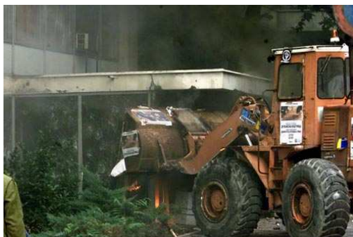
5. oktobar 2001. – Ulaz u RTS

Karakter promena 2000. godine značajno je uticao i na karakter demokratizacije u Srbiji. S obzirom da nije došlo do distanciranja od Miloševićeve politike, tranzicija je bila opterećena ne samo istom politikom, već i istim ljudima. To je najučljivije bilo u medijskoj sferi. S obzirom da je sloboda štampe nedvosmislen znak da li u nekoj državi vlada demokratija i pravna sigurnost, nedoslednost u društvenoj transformaciji u mnogome se prelomila preko medija.