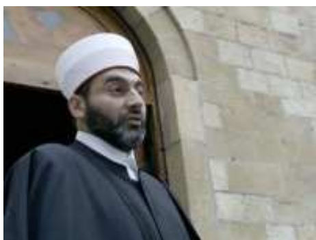
Beogradski muftija Muhamed Jusufspahić

pod formom tzv. statističke regionalizacije treba da dođe do još jednog cijepanja regije Sandžak i u trenutku kada aktuelni bošnjački političari za to i ne mare, kao logično, da ne kažemo spasonosno, nameće se rješenje formiranja Političkog savjeta Glavnog muftije koji bi prije svega savjetodavno, logističko-lobistički, ali i vrlo konkretno i praktično pomogao u borbi protiv diskriminacije nad Bošnjacima, ali i u internacionalizaciji ovog pitanja” 19 .