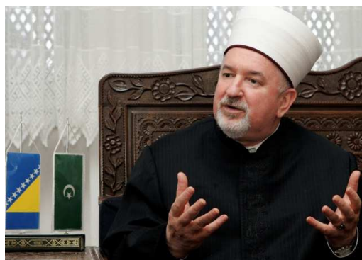
Reis-ul-ulema Mustafa Cerić

Događaji koji su prethodili pomirenju dva lidera, u Sandžaku su iskristalisali probleme ovog regiona. Reč je o poseti vrhovnog poglavara muslimana u BiH reis-ul-uleme Mustafe Cerića i sprečavanje vlasti da održi skup u Tutinu gde bi Cerić govorio na glavnom gradskom trgu, kao i razmena oštrih optužbi između Ministarstva vera i IZ u Srbiji.