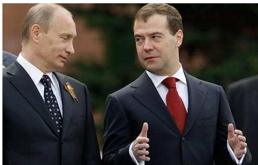
Vladimir Putin i Dmitrij Medvedev

Srbija je izraziti zaokret prema Rusiji učinila tokom mandata vlade Vojislava Koštunice (2004-2008) i to prvenstveno zbog rešavanja statusa Kosova. To je koincidiralo i sa povratkom Rusije u međunarodnu arenu najavljena istupanjem predsednika Vladimira Putina na konferenciji o bezbednosti u Minhenu početkom 2006. godine. Prva demonstracija osnažene ruske pozicije bila je blokiranje rezolucije Saveta bezbednosti o nezavisnosti Kosova. Srbija je, oslanjanjem na rusku podršku Kosovo izdvojila kao spoljnopolitički prioritet sa strategijom da uspori proces priznavanja nezavisnosti. Takođe, inicijativom pred Međunarodnim sudom pravde ona pokušava da obnovi pregovora o statusu Kosova sa ciljem da iznudi njegovu podelu.