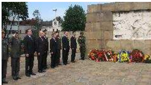
Spomen-groblje oslobodiocima Beograda