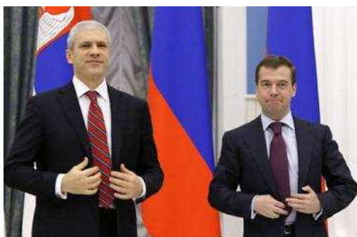
Boris Tadić i Dmitrij Medvedev

Bizarna ilustracija ove ambivalencije je i oduševljenje jednih što se u čast ruskog predsednika okupio orkestar sto trubača koji je u rekordnom roku uvežbao 27 melodija, od domaćeg "Kalašnjikova", do obavezne ruske "Kaljinke" 6 , dok su drugi špekulisali sa cenom tog koncerta koji navodno građane Srbije košta najmanje 130.000 eura. 7