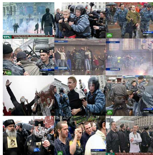
Moskva, Rusija 2006, "НЕ ГЕЀ ПАРАД"

tretiraju kao dan njihove okupaciju od strane SSSR. To je isprovociralo reagovanje Rusije, koja optužuje postokunističke zemlje za revizionizam.