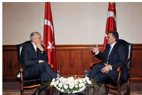
Boris Tadić i Abdulah Gul

Značajnu novu spoljnopolitičku činjenicu predstavlja i aktivnije pozicioniranje Turske u „balkanskim poslovima“. Osim što su Srbiju tokom 2009. godine posetili predsednik Turske Abdulah Gul i šef diplomatije Davatoglu (koji je prilikom boravka u Srbiji posetio i Sandžak), u poslednjim mesecima 2009, intenzivirani su tripartitni susreti šefova diplomatije Turske, Srbije i Bosne i Hercegovine (od septembra 2009. do februara 2010. sastali su se šest puta), što pokazuje nameru Ankare da bude neposrednije uključena u rešavanje potencijalnih kriza na Balkanu - prvenstveno kada je reč o Bosni i Hercegovini, ali i o Sandžaku - kao i da u većoj meri nego do sada doprinosi stabilizaciji regiona.