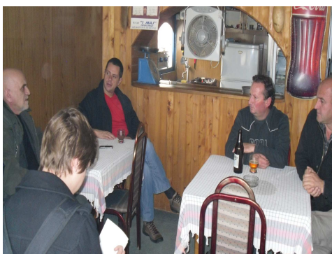
Kampanja Helsinškog odbora

Decentralizacijom i učešćem na izborima dobijaju priliku da sve te institucije dobiju kao "svoje" i da ih imaju "kod kuće". Uoči izbora je izjavio: "Ako Srbi bojkotuju izbore na vlast će doći ljudi koji niti imaju iskustvo, niti znanje, niti dobre namere". 11