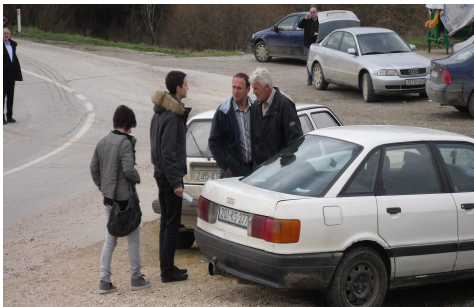
Kampanja Helsinškog odbora

(južno od Ibra) su učinili prvi korak ka uvažavanju realnosti i poslali jasan signal Beogradu da sve manje računaju na mogućnost da im Srbija i njena politička elita mogu biti od pomoći u rešavanju egzistencijalnih problema. Državni sekretar u Ministarstvu za Kosovo i Metohiju, Oliver Ivanović nije krio razočarenje neuspehom bojkota na centralnom Kosovu. On je rekao da su Srbi u centralnom delu Kosova bili skloniji da poslušaju "nečije druge preporuke", kao i da je napravljena pukotina između srpskog naroda i vlasti u Beogradu i da to "znači da mi nismo za njih dovoljan autoritet". 15