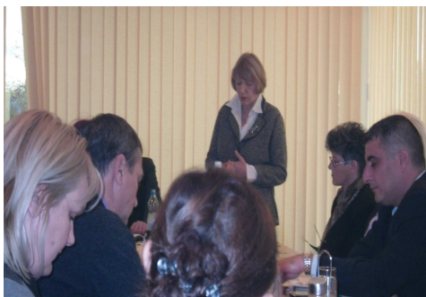
Kampanja Helsinškog odbora

Značaj lokalnih izbora treba prvenstveno posmatrati sa stanovišta mogućnosti realnog uticaja na relevantne odluke od životnog interesa. S obzirom da su izbori na Kosovu bili povezani sa decentralizacijom, što podrazumeva spuštanje nivoa odlučivanja na lokalne organe vlasti, srpska zajednica na Kosovu dobila je jedinstvenu priliku da izborom svojih predstavnika u opštinske skupštine, uključujući i gradonačelnike utiče na poboljšanje svog položaja. Pogotovo što su decentralizacijom Srbi na centralnom Kosovu dobili tri nove opštine – Gračanicu, Klokot i Ranilug - i što je opštini Novo Brdo priključeno više sela u kojima Srbi čine većinu.