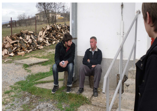
Kampanja Helsinškog odbora

Helsinški odbor već dve godine radi sa srpskom zajednicom na Kosovu 13 što mu je omogućilo uvid u promenu raspoloženja srpske zajednice, posebno nakon proglašenja kosovske nezavisnosti. Naime, odluka Srba južno od Ibra da ostanu, uticala je na njihovo postepeno uključivanje u kosovsku relanost (uzimanje kosovskih dokumenata, obraćanje kosovskim institucijama i sl.). Imajući u vidu sve te promene, Odbor je odlučio da se uključi u kampanju za učešće Srba na izborima. U tom smislu inicirao je Apel kosovskoj srpskoj zajednici da ne propuste šansu, koji je potpisalo 100 istaknutih ličnosti iz javnog života Srbije. To je prvi apel takve vrste posle dugo godina. Desetak dana pre izbora Odbor se aktivno uključio u kampanju, pre svega preko medija, ali i neposrednim obilaskom novih srpskih opština. Osim toga, objavio je apel u tri tiražna dnevna lista ( Večernje novosti , Kurir i Blic ) koji se čitaju na Kosovu. Konferenciju za novinare, koju je Odbor održao u Čaglavici (Kosovo), preneli su svi kosovski mediji, i srpski i albanski. Članovi tima su dnevno učestvovali u tv emisijama. Kampanja je dobro primljena i od srpske i albanske zajednice.