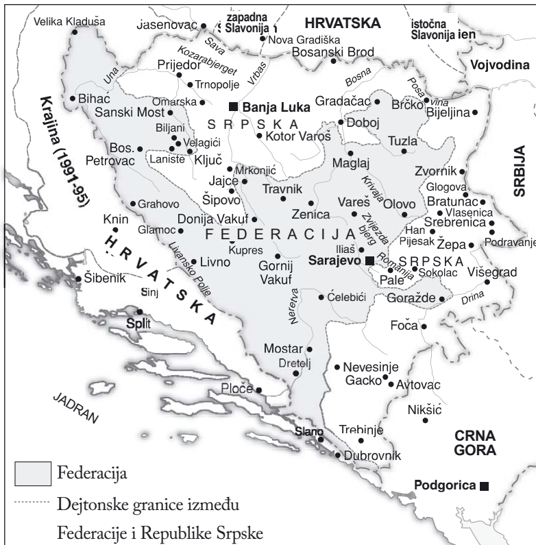
Bosna i Hercegovina