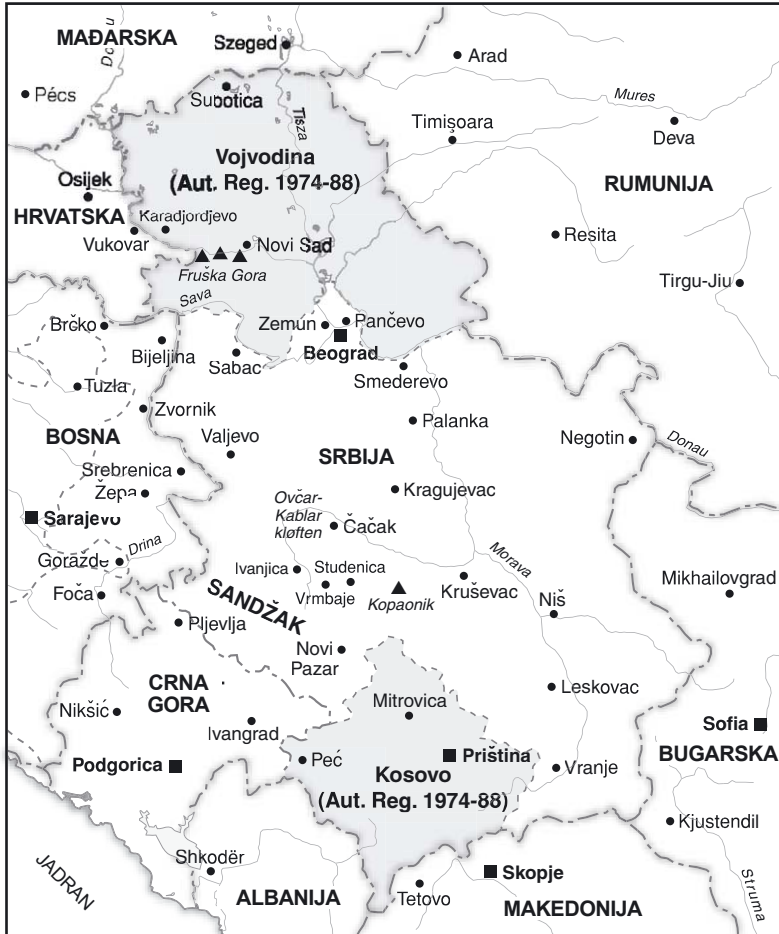
Srbija i Crna Gora