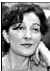
PIŠE: OLGA POPOVIĆ OBRADOVIĆ