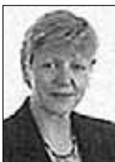
PIŠE: SONJA BISERKO