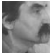
PIŠE: NENAD DAKOVIĆ

Radikali su izveli i pravi strujni udar 30. januara: prostorije Lige socijaldemokrata Vojvodine, Reformista Vojvodine i SPO, sve smeštene u istoj zgradi, oko podne su ostale bez struje. Nije to bio kvar niti restrikcija: kutija sa osiguračima je uništena, razlupana. Kad su stranke prijavile kvar Elektrodistibuciji, odgovoreno im je da je lično predsednik opštine (radikal) urgirao da im se isključi struja! Da li ovde neko preteruje, da ne kažem: laže – za sada nije poznato, ali da struje nema – nema. Sad ligaši – ko verovao, ko ne verovao – drže večernje sastanke uz sveće, a RV se već seli iz prostorija u kojima boravi od 1996. godine. Ligašima je stigao i nalog za prinudno iseljenje: nekom baš smeta ekipa koja ovde širi socijaldemokratiju. Redovne pogrde na račun LDP i LSV, taj vokabular mržnje, nikako da se iscrpi. Nije čudno da mnogi od onih koji još uvek veruju u promene na bolje gube snagu u toj trci, da su se mnogi razboleli (na psihosomatskoj osnovi, od nerviranja, naravno) ili odustali. Nekako izgleda da igramo u nekoj komediji koja nikog ne zasmehava, u tragediji kojoj se ne vidi kraj, ili drami koja više nikoga ne navodi na razmišljanje. Publika je otišla za svojim poslom, a mi i dalje igramo. Sve opcije su u igri osim odustajanja. ■■