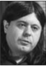
PIŠE: TEOFIL PANČIĆ