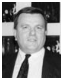
PIŠE: IVAN MRĐEN