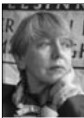
PIŠE: SONJA BISERKO