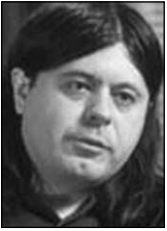
PIŠE: TEOFIL PANČIĆ