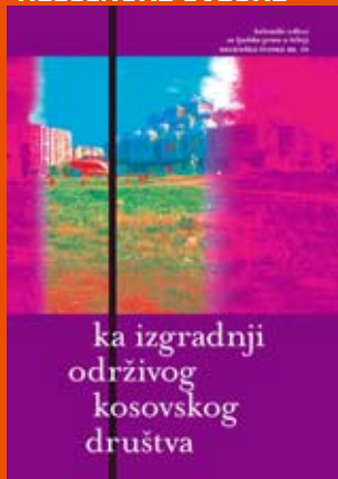
26. Ka izgradnji održivog kosovskog društva