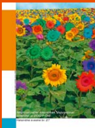
27. multietnički identitet Vojvodine: Izazovi u 2007 - 2008