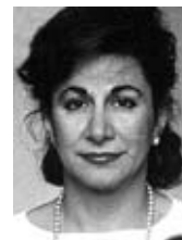
PIŠE: SLOBODANKA AST

"Smatrala sam da učenici koji idu u drugi razred srednje škole i imaju 16 godina treba pred sobom da imaju i neke druge primere patriotizma, pa sam ih pitala da li žele da čuju i priču o jednom generalu koji je, smatrajući da postupa kao patriota,