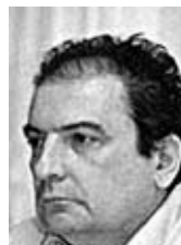
PIŠE: VLADIMIR GLIGOROV

Zato bi koaliciona vlada, Demokratska stranka i predsednik Tadić, pre svega, morali napraviti rezove koji bi im doneli novu podršku građana. Odnosno, moraju biti jasniji u svojoj proevropskoj politici, ne samo na nivou mehaničkog ponavljanja "kako je Srbija Evropa". Neophodna je ofanzivna kampanju u kojoj bi jasno predočili šta ta politika znači ne samo na ekonomskom, već i na vrednosnom i moralnom planu. Samo tako moguće je sprečiti dalje rastakanje društvenog tkiva i njegovo mobilisanje na društveno kreativnoj viziji.