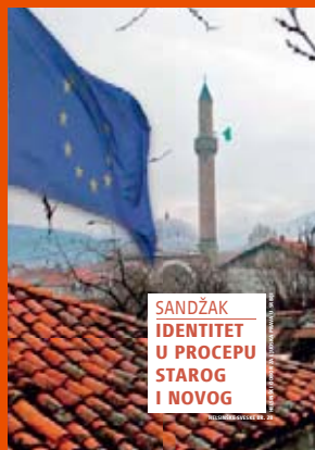
28. Sandžak: Identitet u procepu starog i novog