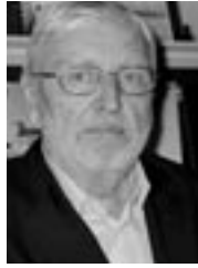
PIŠE: BORA ĆOSIĆ