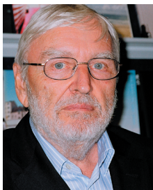
PIŠE: BORA ĆOSIĆ