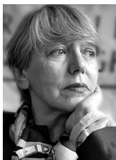
PIŠE: SONJA BISERKO