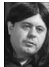
PIŠE: TEOFIL PANČIĆ

Slično kao i balkanski partneri, i međunarodna zajednica radije operiše sa onim što neće, zabavljajući se traženjem načina da Srbima saopšti da je nezavisnost Kosova svršeni čin, a Albancima da na tu nezavisnost moraju da čekaju neko vreme. Čini se da je već postignuta saglasnost da dijalog počne, ali da ne bi trebalo sprovoditi bilo kakav dogovor između Beograda i Prištine dok se ne proglasi nezavisnost pokrajine. Naravno, Srbiji bi trebalo olakšati gutanje gorke pilule, a to bi moglo da bude ekspresno rešenje nekih pitanja na kojima Srbija bezuspešno insistira. Dakle, izgleda da za međunarodnu zajednicu nije sporno da, uprkos povremenim i čak iskrenim željama Brisela i Vašingtona, nema dobre zamene za odluku o nezavisnosti Kosova i da je osnovni problem u odnosima SAD i Evrope ne dogovor o konačnom statusu već samo dogovor o redosledu koraka koji bi vodili ka rešavanju konačnog statusa, uz odgovarajuće nagrade za Srbiju, koja svojim svakodnevnim državnim aferama i skandalima lišava međunarodnu zajednicu dobrog dela razloga za naklonosti i obzire.