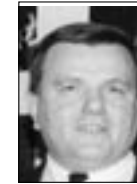
PIŠE: IVAN MRĐEN