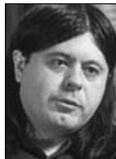
PIŠE: TEOFIL PANČIĆ

Srpski antievropski stav je duboko ukorenjen i zbog toga uslovljavanje EU nije dovoljno da Srbiju okrene liberalnim vrednostima. Stoga sui neophodni nov pristup i vreme kako bi se stvorile nove generacije sposobne da se suoče sa realnošću i nasleđem Miloševićeve Srbije. ■