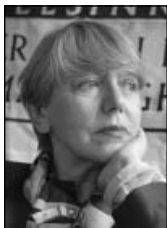
PIŠE: SONJA BISERKO