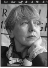
PIŠE: SONJA BISERKO