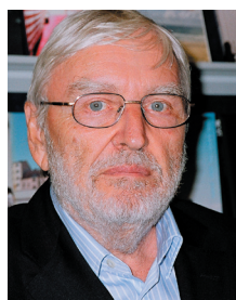
PIŠE: BORA ĆOSIĆ

Ove godine punim šezdeset godina. Počinjem da shvatam koliko je bio mlad Če Gevara. Svet nije pravedan. Ali je uporan. ■