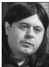
PIŠE: TEOFIL PANČIĆ