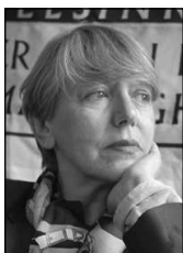
PIŠE: SONJA BISERKO