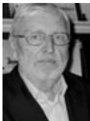
PIŠE: BORA ĆOSIĆ