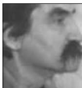
PIŠE: NENAD DAKOVIĆ