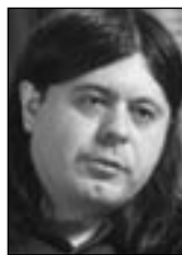
PIŠE: TEOFIL PANČIĆ

Sve dok se ne definišu moralni principi i obaveze koji karakterišu demokratska društva, teško je očekivati da će Srbija pred svetom moći odbraniti teze koje formulišu prominentni intelektualci poput Milorada Ekmečića. ■