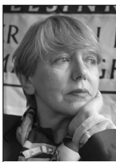
PIŠE: SONJA BISERKO