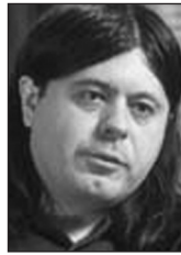
PIŠE: TEOFIL PANČIĆ

Političari dolaze i odlaze, posledice i računi, nažalost, ostaju narodu i građanima. ■■