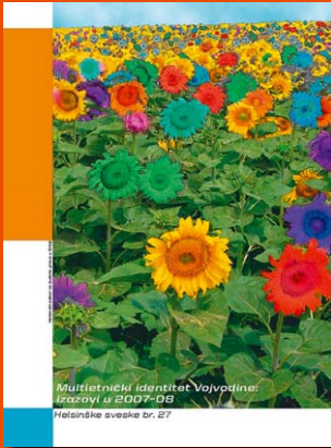
27. Multietnički identitet Vojvodine: Izazovi u 2007 - 2008