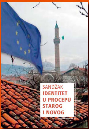
28. Sandžak: Identitet u procepu starog i novog