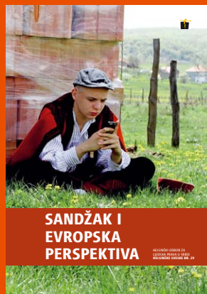
29. Sandžak i evropska perspektiva