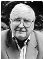
PIŠE: BORA ĆOSIĆ