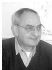
PIŠE: DIMITRIJE BOAROV