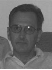
PIŠE: TODOR KULJIĆ