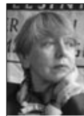
PIŠE: SONJA BISERKO