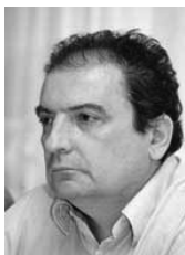
PIŠE: VLADIMIR GLIGOROV