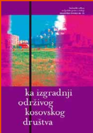
26. Ka izgradnji održivog kosovskog društva