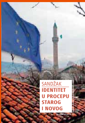
28. Sandžak: Identitet u procepu starog i novog