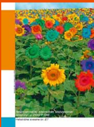
27. multietnički identitet Vojvodine: Izazovi u 2007 - 2008