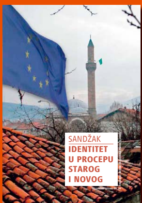
28. Sandžak: Identitet u procepu starog i novog