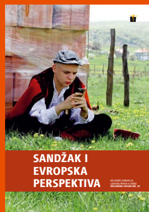
29. Sandžak i evropska perspektiva