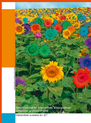
27. Multietnički identitet Vojvodine: Izazovi u 2007 - 2008