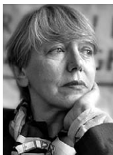
PIŠE: SONJA BISERKO