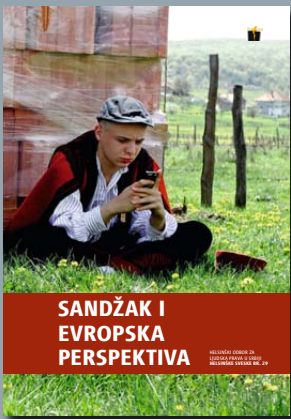
29. Sandžak i evropska perspektiva