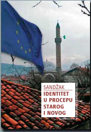
28. Sandžak: Identitet u procepu starog i novog