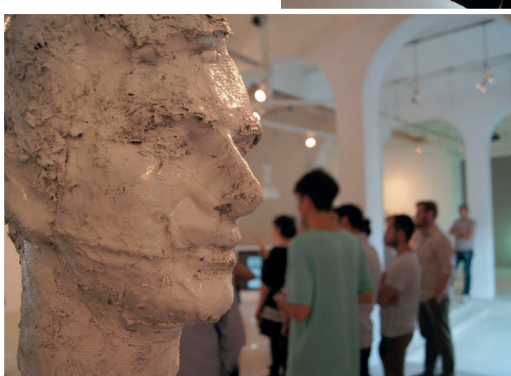
Agron Bljakćori: Skulptura