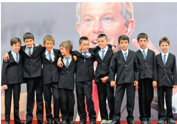
Devet dečaka, rođenih 1999, nazvano je Tonibler po tadašnjem britanskom premijeru Toniju Bleru: Rad Albana Muje „Toniblerovi“

Očima poznatih kuratora svi smo viđeni kao umetnici sa Balkana