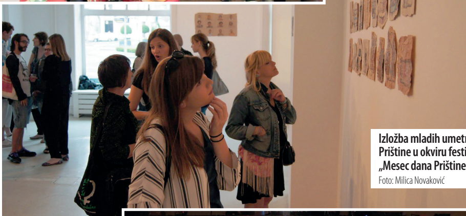
Izložba mladih umetnika iz Prištine u okviru festivala „Mesec dana Prištine u Beogradu“