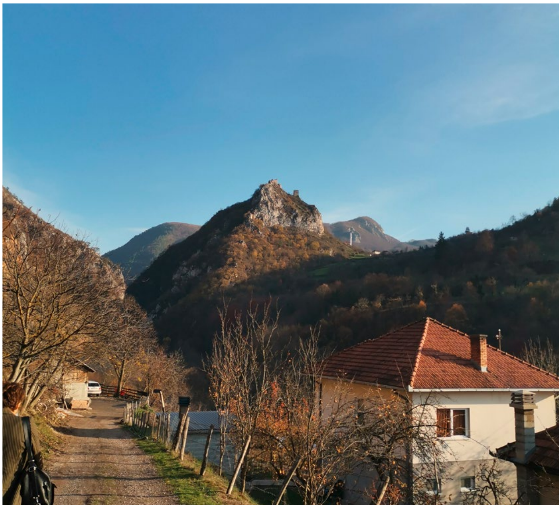
Okolina manastira Mileševa