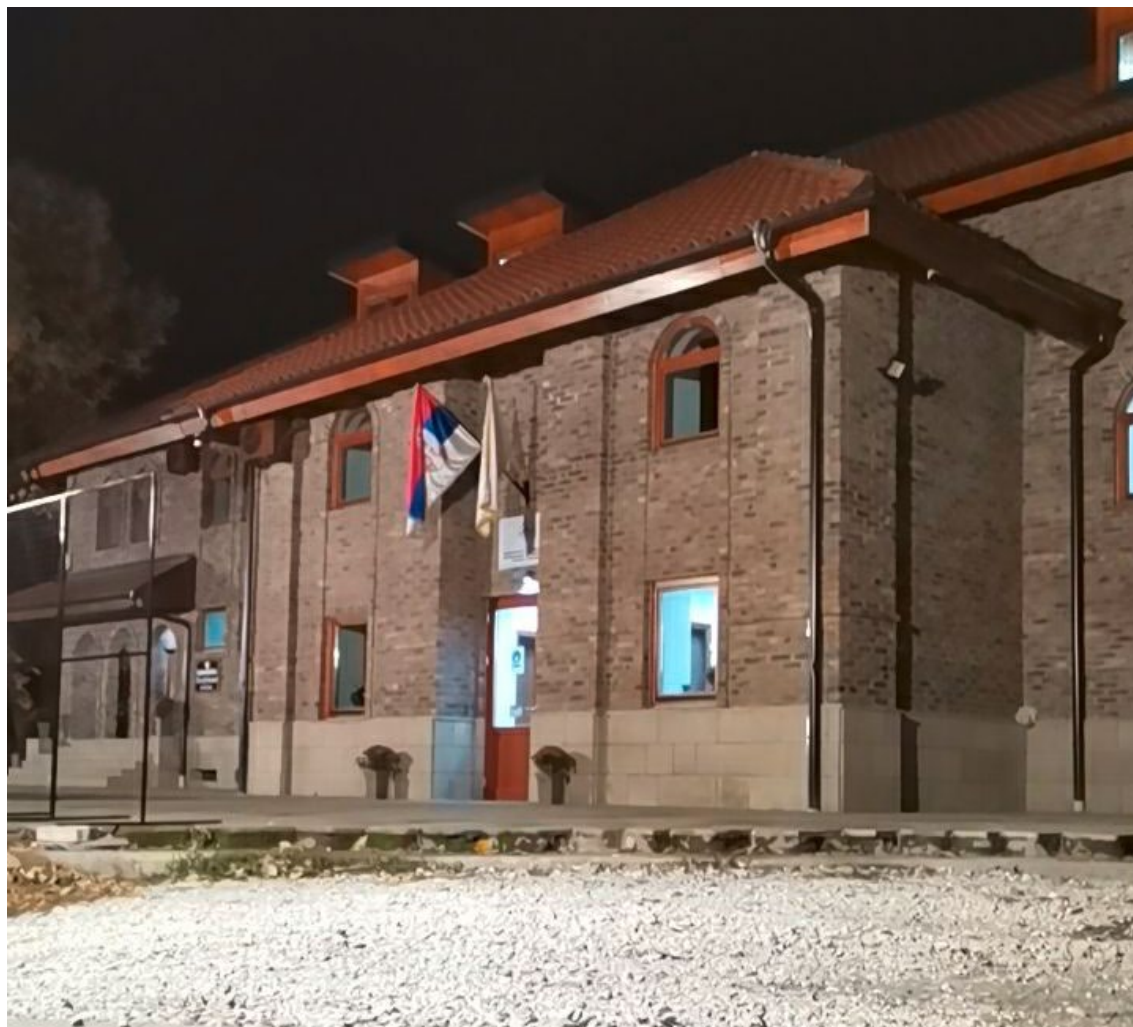
Biblioteka u Novom Pazaru