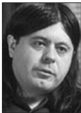
PIŠE: TEOFIL PANČIĆ